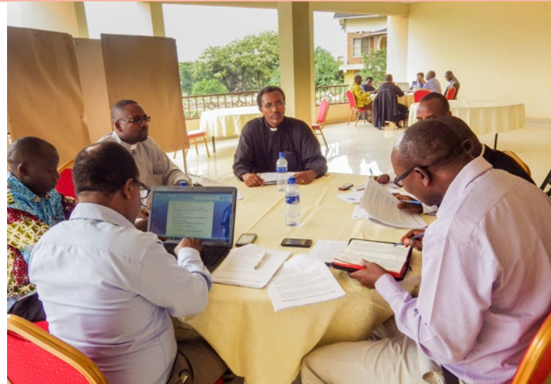
Atelier de validation de l'outil « Jeunesse victorieuse » avec les leaders religieux

Lancé en 2013, le Réseau des Confessions religieuses pour la promotion de la santé et le Bien-être Intégral de la Famille (RCBIF) associe les Diocèses Catholiques, Anglicans, les missions agréées de l'Eglise de Pentecôte et la communauté Islamique du Burundi. Mettant l'accent sur le « Bien-être intégral de la famille » et le développement communautaire, le RCBIF situe la SSR dans le contexte global de l'entente harmonieuse d'un couple empreint de valeurs éthiques et d'une éducation à la santé sexuelle et procréative responsable de la jeune génération. Le RCBIF a des structures décentralisées jusqu'au niveau collinaire – les Comités Ndemeshabuzima (« Promotion de la santé ») – qui interagissent avec les Eglises, les fidèles, l'administration locale et les partenaires de la santé. Le RCBIF collabore avec différents partenaires et est actif dans les domaines de la santé communautaire, la santé maternelle et infantile et la lutte contre le VIH/SIDA.